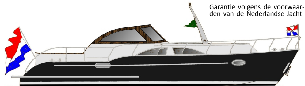
CROWN ADMIRAL 35 CABRIOLET met grote kajuitramen en massief teakhouten windscherm/stuurhuis.

Garantie volgens de voorwaarden van de Nederlandse Jacht-